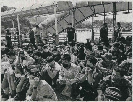
ส่งกลับ - เจ้าหน้าที่ดูแลสุขภาพจิต จ.ระยอง นำแรงงานต่างด้าวที่ลักลอบเข้าเมืองโดยผิดกฎหมาย ที่ขึ้นเถื่อนคดี 141 คน ส่งกลับไปยัง จ.บึงฉลวย ประเทศเมียนมา โดยมี นายเอเชิน และ ผู้ช่วยชุดแรงงานเมียนมา ประจำพื้นที่ จ.ระยอง ร่วมเป็นสักขีพยาน ที่ ท่าเทียบเรือศุลกากร บ้านชามางหงษ์ หมู่ 6-6 คบ.บ้าน อ.เมือง จ.ระยอง เมื่อวันที่ 28 พฤศจิกายน

พญ.อัมพรกล่าวว่า ขณะนี้กรมสุขภาพจิตได้ส่งรถโมบายเคลื่อนที่เข้าไปคลายเครียดให้กับประชาชนถึงชุมชน เน้นออกไปทำการส่งเสริมพัฒนาการให้เด็ก โดยมีทั้งหมอสื่อจิตฯ ของเล่น และให้คำแนะนำกับผู้ปกครองเด็กในเรื่องของการเลี้ยงดูบุตรหลานอีกด้วย